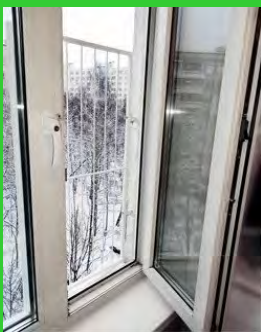
Фиксаторы, ограничители поворота